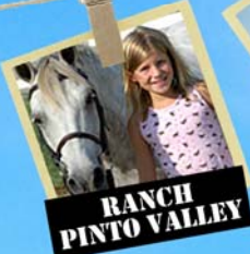
RANCH PINTO VALLEY