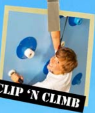
CLIP 'N CLIMB